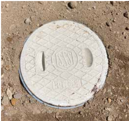
グリストラップ（蓋を閉めた状態）

地域によっては、キッチン排水にグリストラップ（ゴミや油分の除去のためのトラップ）の設置が義務付けられている場合がございます。グリストラップに溜まったゴミや油分は定期的なお掃除が必要です。詳しくはお住まいの地域の上下水道課へお問い合わせください。