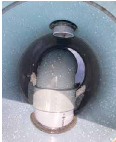
グリストラップ（蓋を開けた状態）